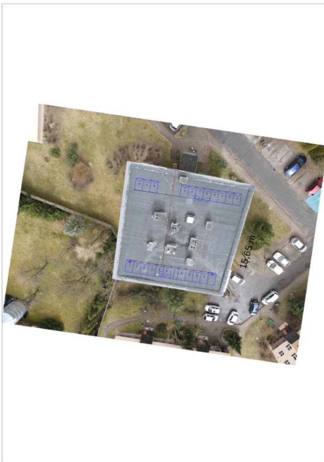
Figura 2: Umieszczenie generatora fotowoltaicznego i grupy konwersji